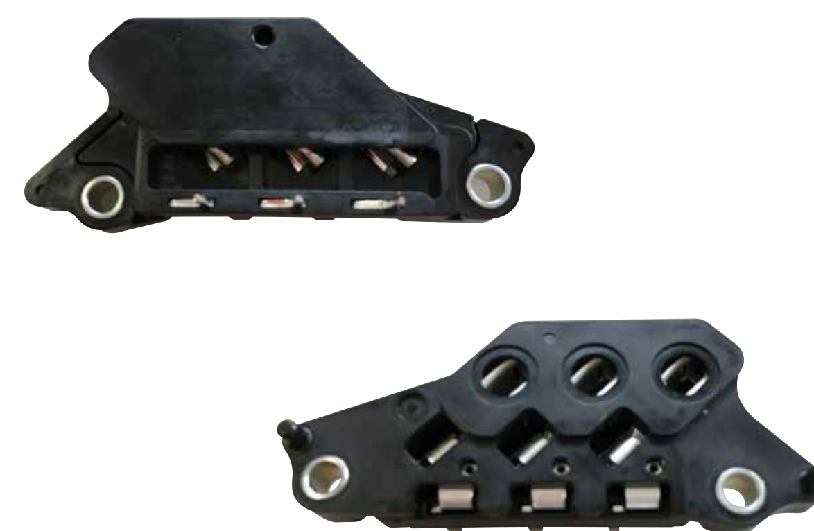
電動コンプレッサ用部品